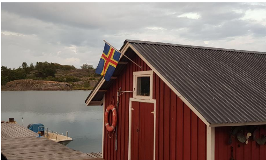
Kökar Ahvenanmaa 2019