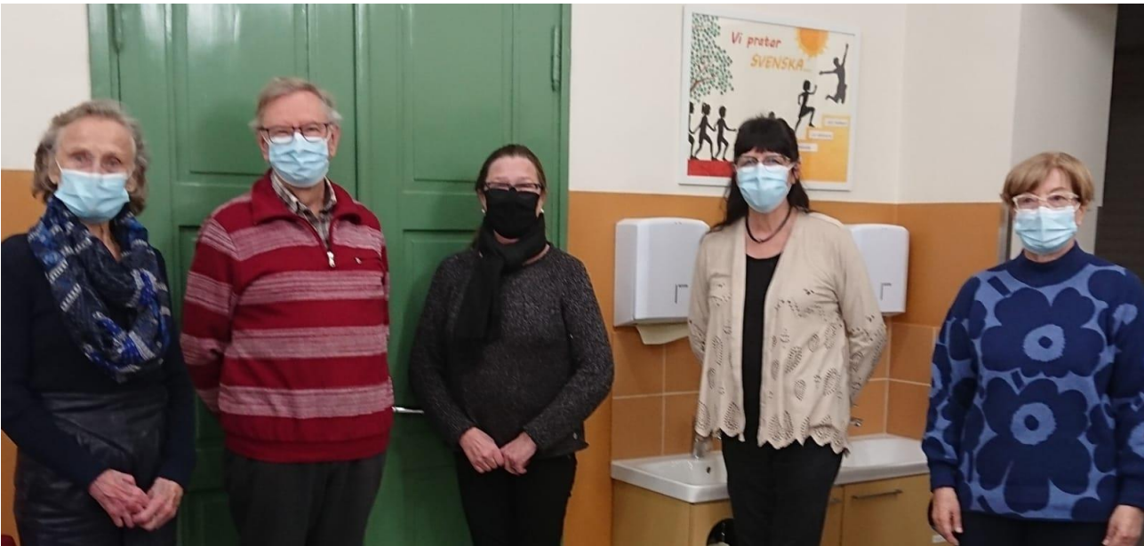
Ivriga medlemmar av Samtalsklubb i sista mötet under hösten 2020

Yhteistyömme Svenska skolanin kanssa on tiivistynyt ja olemme nyt osa För Svenska i Lahtis -yhdistystä. Saamme nauttia myös Lahteen saadusta Luckan-toiminnasta. Se on suomenruotsalainen informaatio- ja kulttuurikeskus, jollainen on kahdellatoista suomalaisella paikkakunnalla. Nyt siis myös Lahdessa! Tillsammans är vi mera.